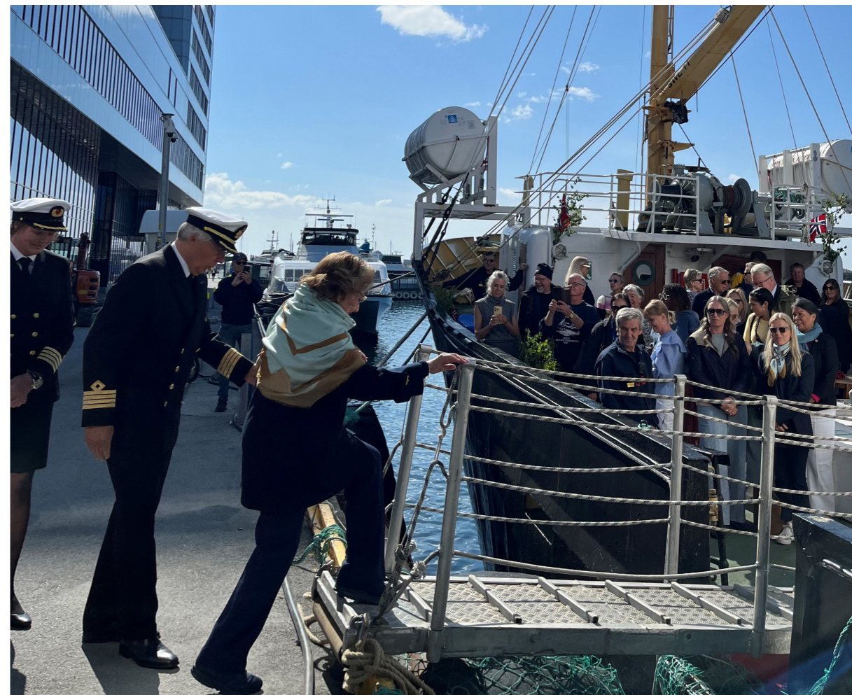
Dronning Sonja på tur ombord i forbindelse med dåpen av MS Salten.