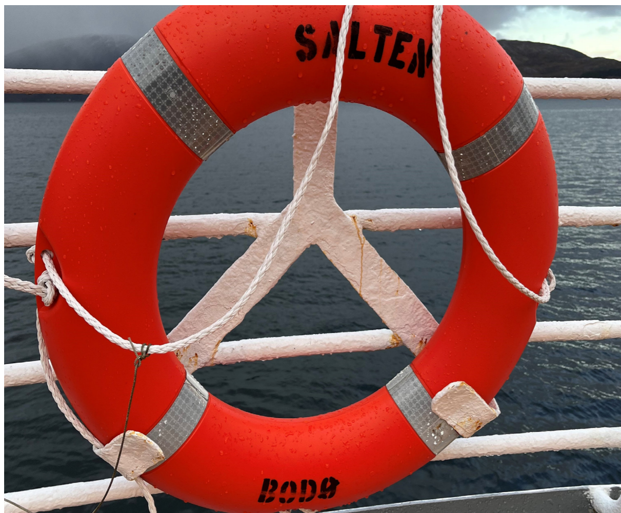
Den gamle livbøyen på MS Salten.