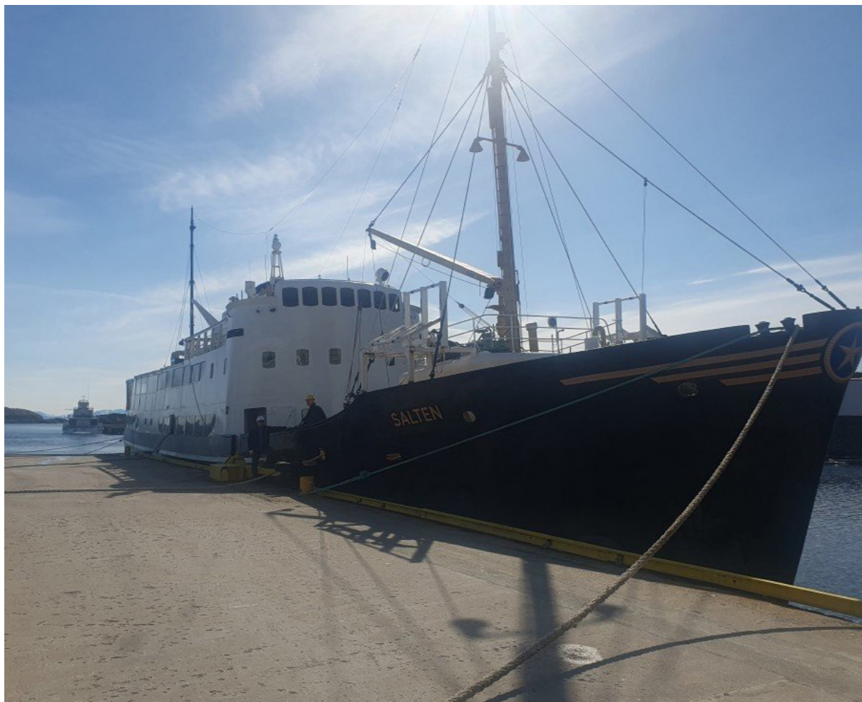
Vårt stolte gamle skip til kai.